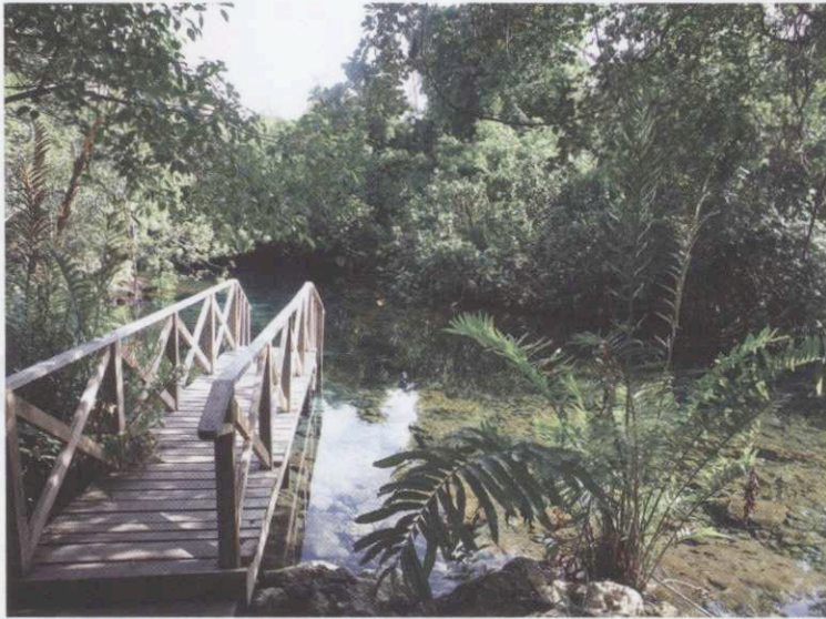
● Sendero Ecológico

Hemos construido nuestro sueño haciendo realidad cada uno de los tuyos.